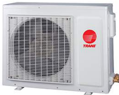
TWK: Unidad exterior Bomba de Calor